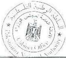
سلام فياض رئيس الوزراء