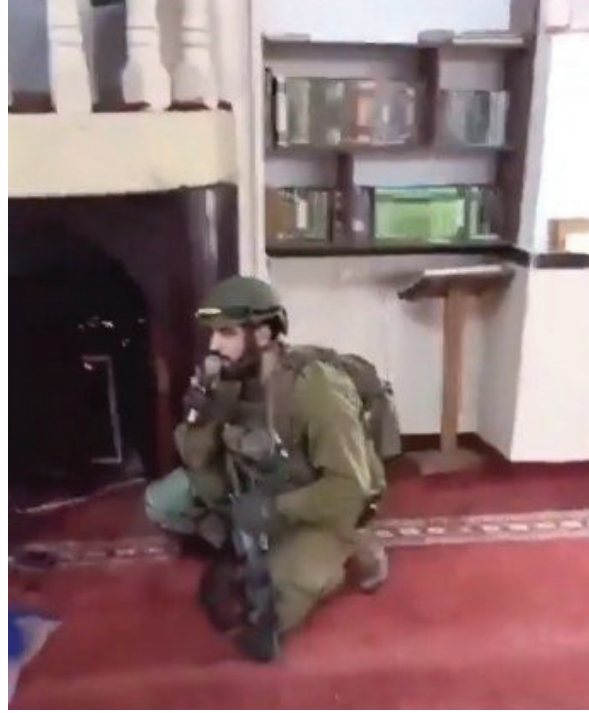
اقتحام عدد من جنود الاحتلال الإسرائيلي مسجداً في مدينة جنين وأداء طقوس تلمودية عبر مكبرات الصوت