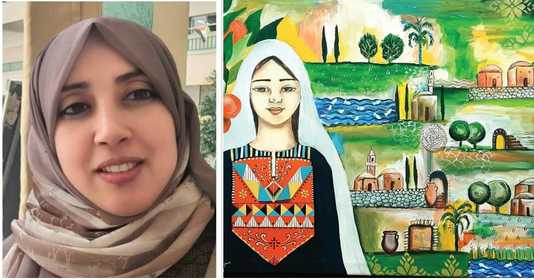
لوحة للفنانة هبة زقوت والتي استشهدت نتيجة استهدافها وعائلتها بالطيران الحربي الإسرائيلي

❖ استشهد وزير الأوقاف والشؤون الدينية وخطيب المسجد الأقصى المبارك السابق الشيخ يوسف سلامة إثر استهداف صواريخ الاحتلال لمنزله بشكل مباشر في مخيم المغازي. وكان سلامة أحد خطباء المسجد الأقصى، لكن الاحتلال منعه من دخوله بعد حصار غزة عام 2007. كما شغل منصب النائب الأول المنتخب لرئيس الهيئة الإسلامية العليا بالقدس. وألف سلامة دليلاً خاصاً بالمسجد الأقصى، وكان عضواً استشارياً في كلية القرآن والدراسات الإسلامية بجامعة القدس/أبوديس، وكان صاحب فكرة طباعة مصحف بيت المقدس.