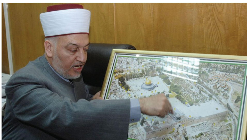
The occupation assassinated the former of Minister of Endowments and Religious Affairs and the Imam of Al-Aqsa Mosque, Sheikh Yusuf Salama