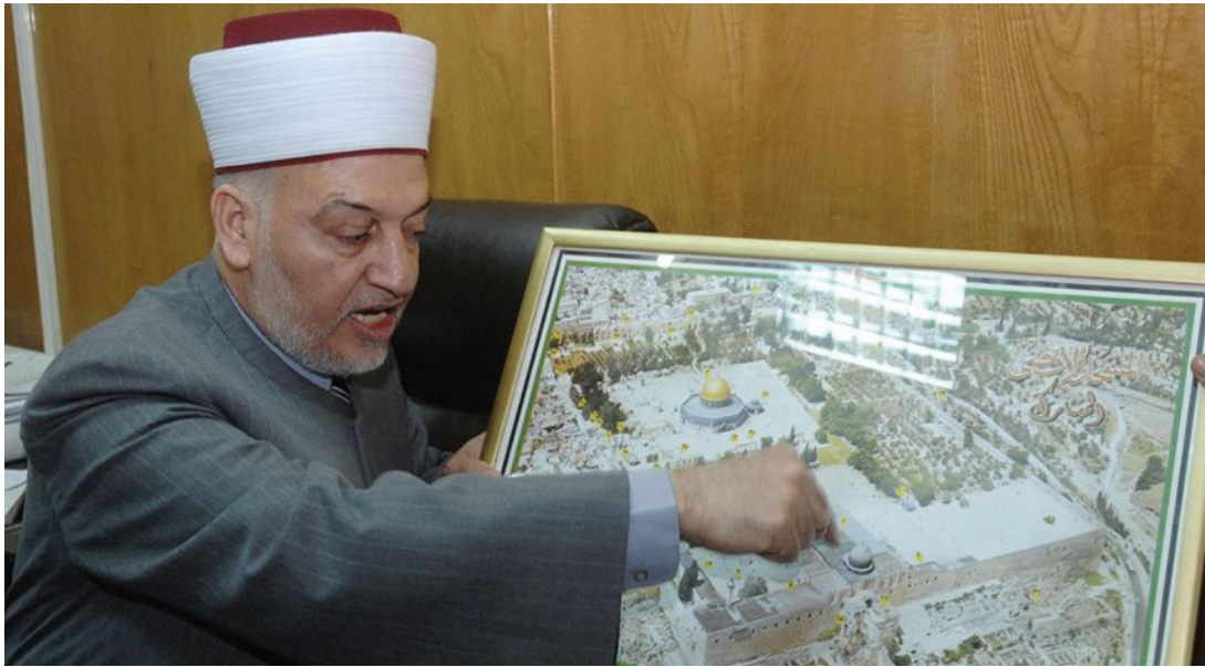
الاحتلال يغتال وزير الأوقاف والشؤون الدينية وخطيب المسجد الأقصى السابق الشيخ يوسف سلامة