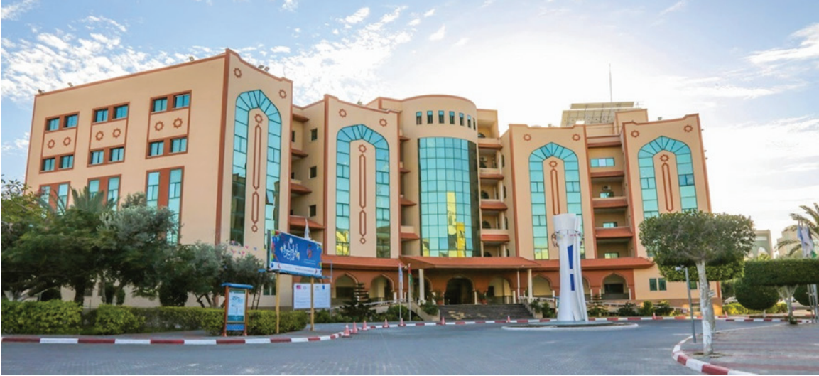
لحظة تدمير الجامعة الاسلامية في قطاع غزة التي تستضيف كرسي «اليونسكو» لعلوم الفلك والفيزياء الفلكية وعلوم الفضاء