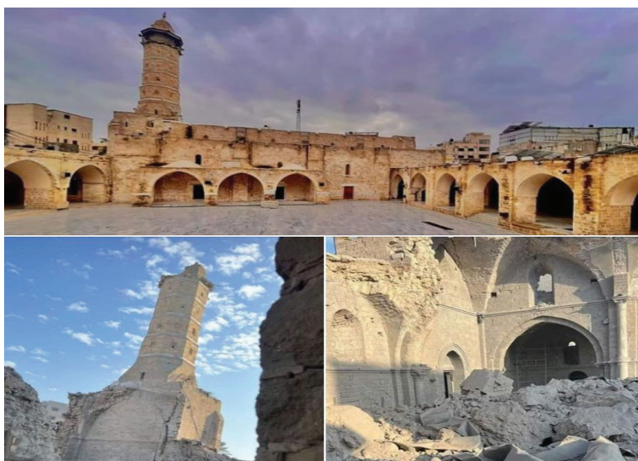
Al-Omari Mosque.. Occupation missiles destroyed one of the oldest places of worship in the world