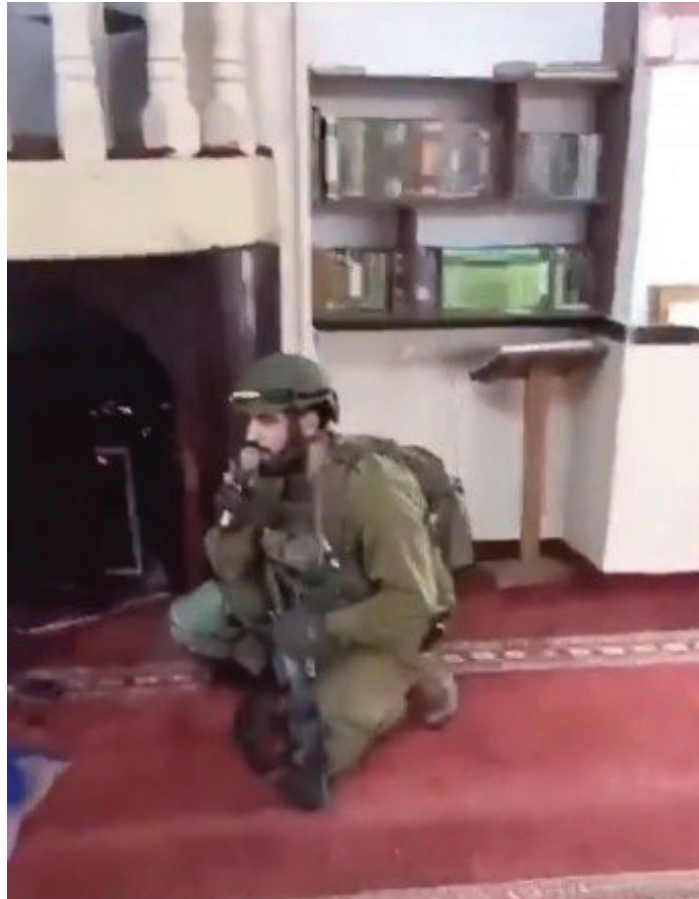
Some Israeli occupation soldiers stormed a mosque in the city of Jenin and performed Talmudic rituals over loudspeakers