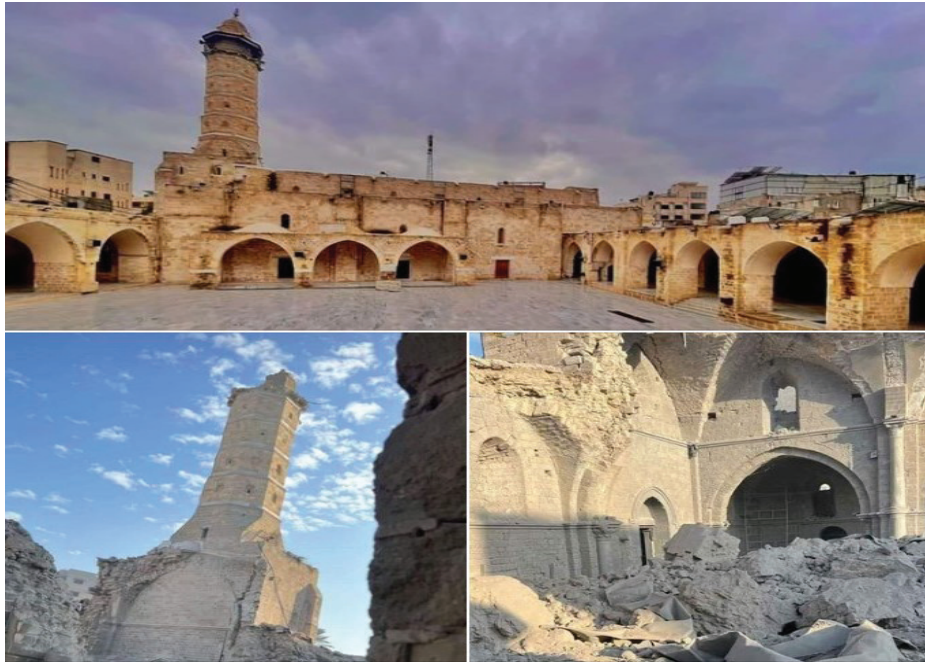
المسجد العمري.. صواريخ الاحتلال تدمر أحد أقدم أماكن العبادة في العالم

❖ سرق جنود الاحتلال الاسرائيلي في قطاع غزة نقوداً وذهباً وتحفاً ومعادن ومشغولات يدوية تُقدّر أنها بعشرات ملايين الدولارات.