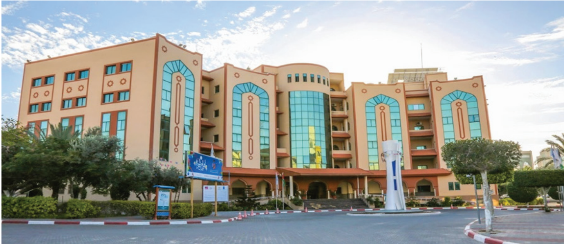
The moment of the destruction of the Islamic University in the Gaza Strip, which hosts the UNESCO Chair for Astronomy, Astrophysics and Space Sciences